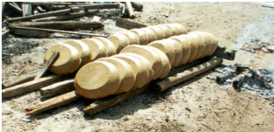
“CAMA” DE PANELAS A SER COBERTA COM LENHA PARA A QUEIMA.

intervenções nas condições de produção, comercialização e promoção das panelas de barro. Exemplos de iniciativas desse tipo têm sido as do Sebrae, no desenvolvimento de embalagens para as panelas, e as festas anuais das paneleiras, com o apoio das instituições governamentais. O acompanhamento do Iphan tem balizado o apoio e o fomento a ações relacionadas à instrumentalização das paneleiras, assim como à implementação das condições necessárias à sustentabilidade de sua produção.