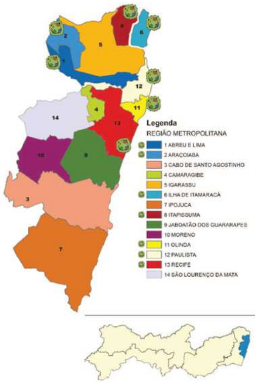
Figura 1: Mapa da Região Metropolitana de Recife