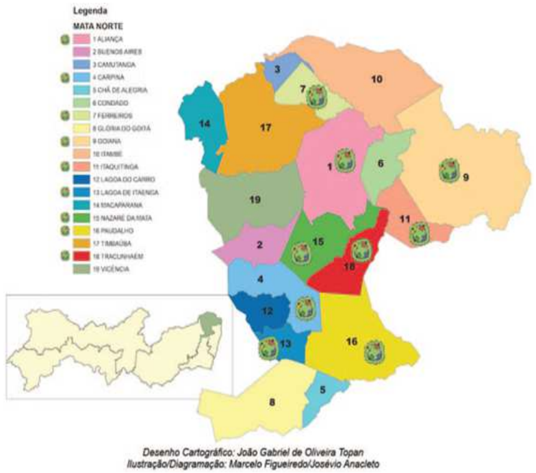
Figura 2: Mapa da Região da Zona da Mata Norte