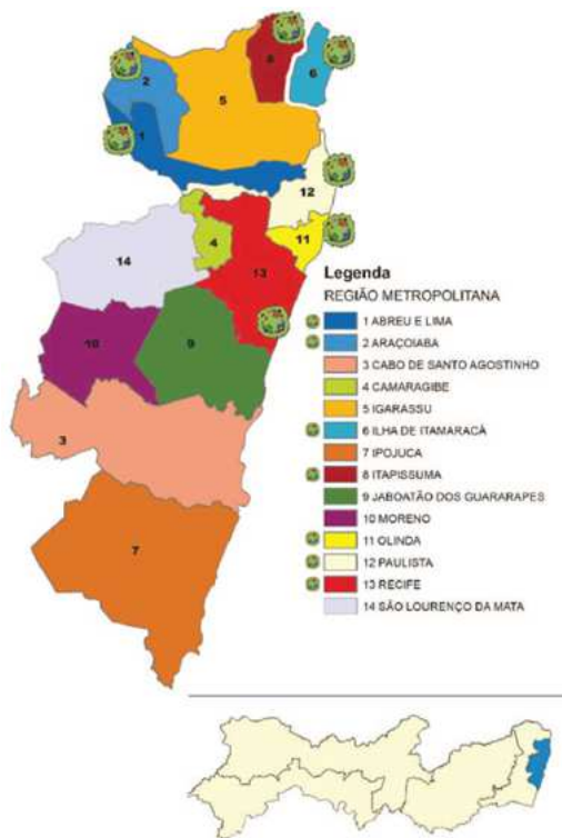
Desenho Cartográfico: João Gabriel de Oliveira Topan Ilustração/Diagramação: Marcelo Figueiredo/Josévio Anacleto