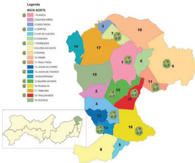
Desenho Cartográfico: João Gabriel de Oliveira Topan Ilustração/Diagramação: Marcelo Figueiredo/Josévio Anacleto