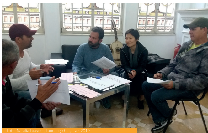
Fandango Caçara - 2019

Um excelente recurso de facilitação gráfica que pode ser usado nas etapas de elaboração do plano de salvaguarda são as tarjetas, já aplicadas com sucesso na construção de alguns planos de salvaguarda existentes. Várias ferramentas participativas possibilitam a utilização de tarjetas de papel como forma de organização das ideias, podendo ser executada no grande grupo da equipe de trabalho, ou em pequenos grupos de modo a focalizar melhor as questões a serem trabalhadas. Seu uso permite uma melhor visualização das questões discutidas, facilitando sua apreensão por parte do grupo e favorecendo a articulação das ideias, a tomada de decisões e a produção de consensos, mostrando-se muito adequada para elaborar eixos, objetivos e ações do plano de salvaguarda.