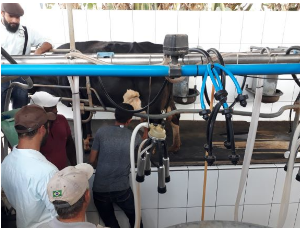
Legenda: Ordenha – Região Cerrado