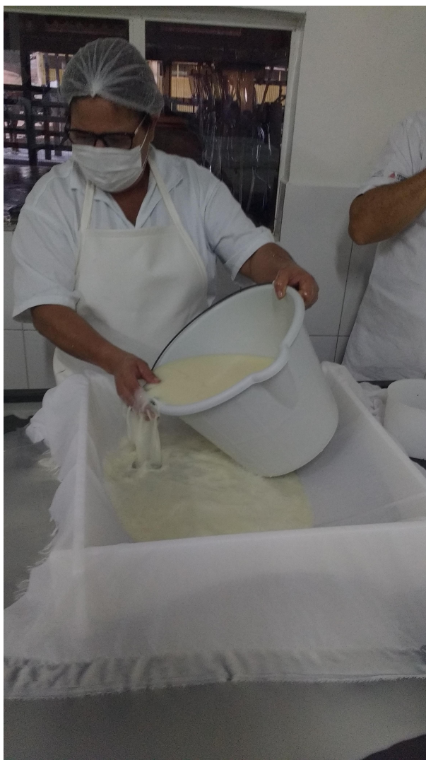
Legenda: Dessoragem da massa – Região Serro

Assim, tanto os parceiros e representantes de produtores presentes nas reuniões de avaliação quanto aqueles que se manifestaram nos debates ocorridos nas regiões produtoras em torno do roteiro enviado foram unânimes em afirmar que nenhum aspecto culturalmente relevante desapareceu ou foi substancialmente modificado em comparação ao momento do Registro do Modo Artesanal de Fazer Queijo de Minas como Patrimônio Cultural do Brasil, no que diz respeito às formas de manipulação do leite, do coalho, das massas e dos tempos de maturação dos queijos. As transformações identificadas foram creditadas à própria dinâmica entre mudança e permanência que marca esse saber-fazer no estado, ainda que tenha sido expressa a preocupação com os limites tênues entre a existência de mudanças que não o descaracterizam e as que podem vir a interferir na permanência desse modo de fazer como referência cultural para seus detentores e como marca identitária de Minas Gerais para os mineiros e no contexto nacional, conforme indicado no Dossiê de Registro e reafirmado em várias reuniões da salvaguarda.