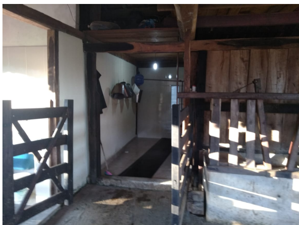
Legenda: Instalações curral – Região Serro Fonte: EMATER-MG, 2020