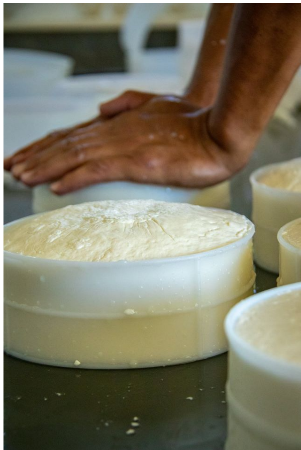
Legenda: Prensagem manual – Região Canastra