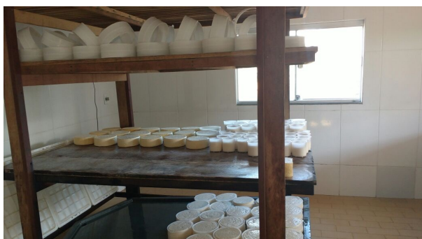
Legenda: Prateleira de maturação – Região Cerrado