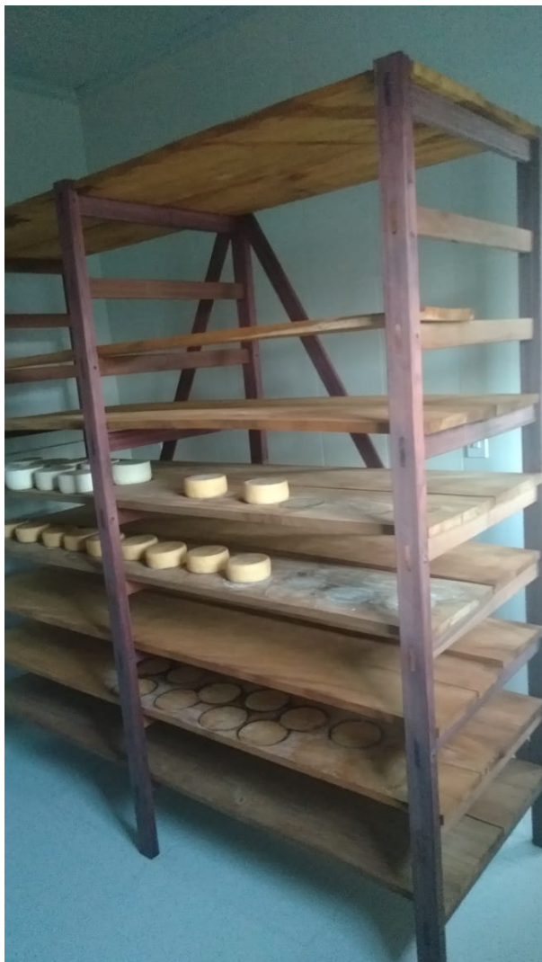
Legenda: Prateleiras de maturação, Região Serro

Ainda que não tenha aparecido de forma tão generalizada nas avaliações dos produtores e parceiros quanto as transformações anteriormente abordadas, outra mudança apontada pelos produtores das