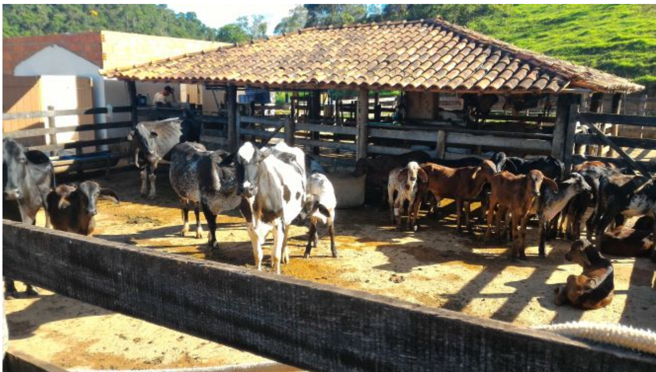
Legenda: Instalação de curral e bovinos – Região Serro