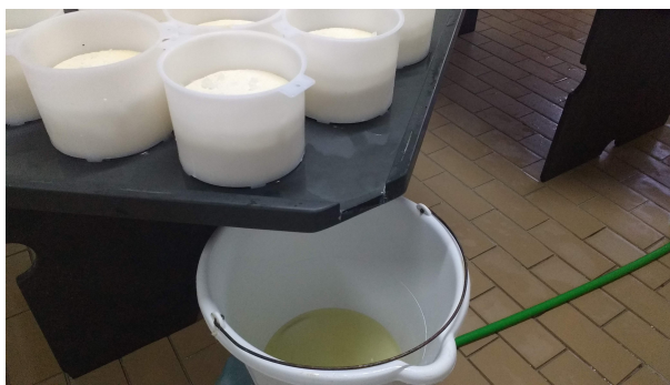
Legenda: Coleta do pingo – Região Serro