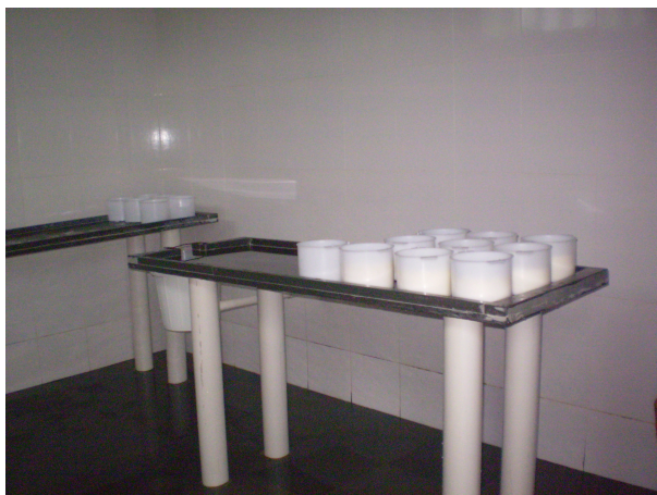
Legenda: Dessoragem e coleta do pingo – Alvorada de Minas/Região Serro