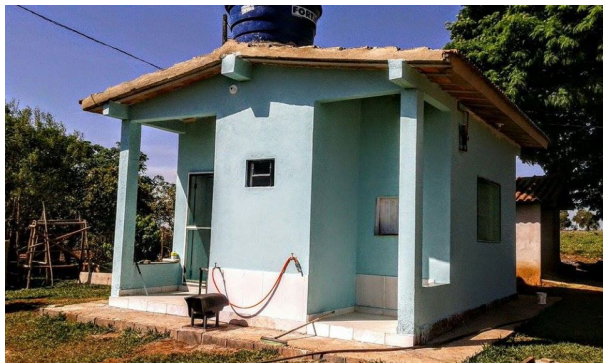
Legenda: Queijaria – Região Canastra

do fazer o queijo, foram no geral consideradas como positivas, uma vez que contribuíram não só para a maior segurança alimentar do produto, mas também para sua valorização – o que é avaliado, pelos detentores, como fator primordial para a salvaguarda dos seus saberes. Outros espaços de produção que sofreram intervenções foram os currais e áreas de ordenha, para os quais também foram aplicadas legislações de controle sanitário, mas estas foram igualmente consideradas alterações que beneficiaram a valorização do produto e do seu modo de fazer, ao propiciarem maior segurança para o produtor e controle da qualidade do leite e, conseqüentemente, do queijo.