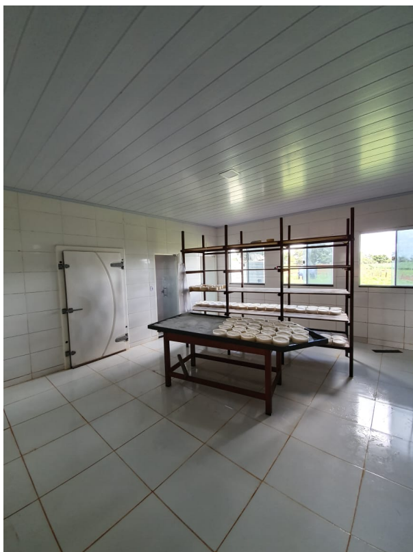
Legenda: Instalações – Região Cerrado