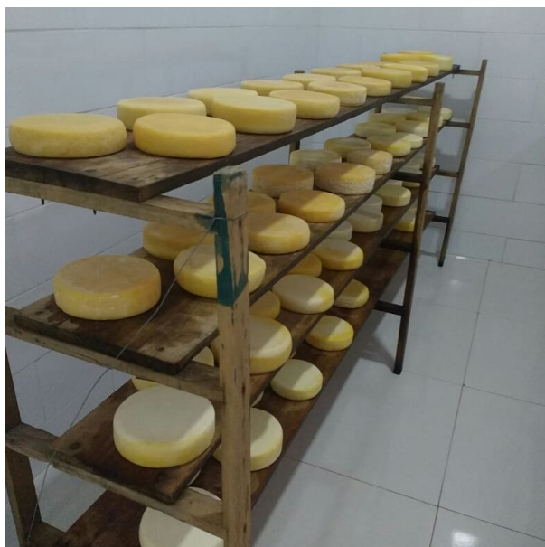
Legenda: Maturação do queijo – Região Canastra