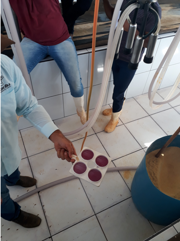
Legenda: Exame de CMT – Região Cerrado

ser associadas à maior preocupação com a questão da segurança alimentar e à adequação da produção às legislações vigentes. Essas inovações geraram, por sua vez, a implantação de processos e ferramentas de controle da produção (como planilhas, por exemplo) e o maior rigor com a documentação do cotidiano da produção, o que tem interferido, conforme relatado por alguns produtores, no tempo que dispõem para dedicar à feitura do queijo – fato que pode vir a gerar demanda por mão de obra extrafamiliar, o que, além de intervir na forma de organização do trabalho que caracteriza este modo de produção artesanal, amplia seus custos, afetando sobretudo os menores produtores.